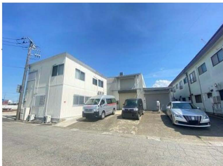
※図面と現況が異なる場合、現況を優先します。