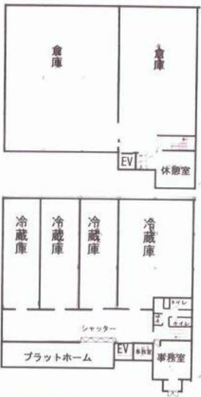
図面と相違する場合は現況を優先致します。