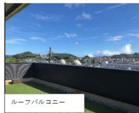
ルーファルコニー