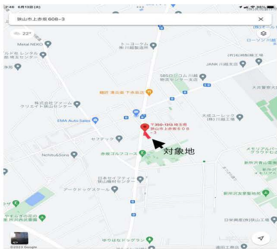
Googleマップ: 狭山市上赤坂608-3 県道川越所沢線沿い