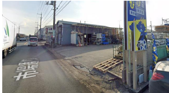
所沢インター方面→