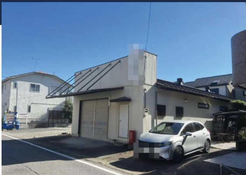
平家建 駐車スペース付(乗用車一台分) 雑貨小物等の保管倉庫におすすめ!