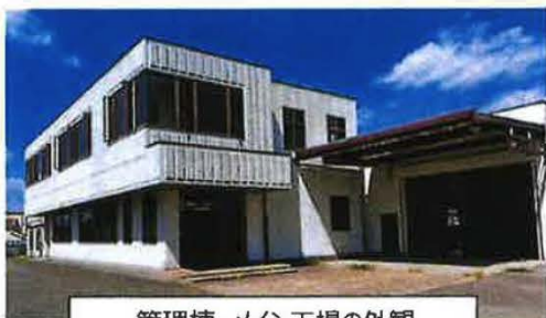
管理棟、メイン工場の外観