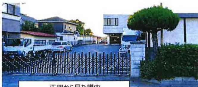
正門から見た構内