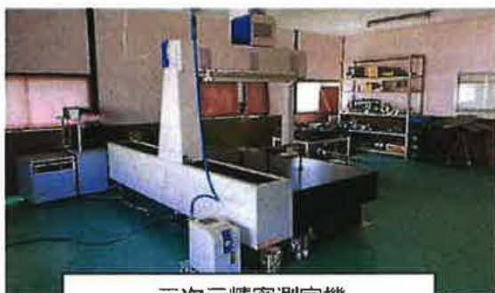
三次元精密測定機