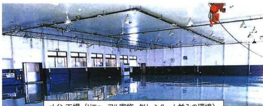
メイン工場（リニューアル実施、クリーンルーム並みの環境）