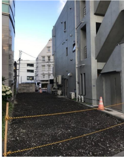
※現在はアスファルト敷