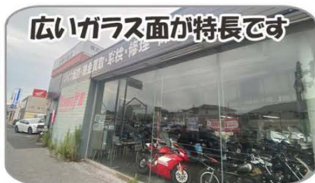
広いガラス面が特長です