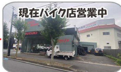
現在バイク店営業中