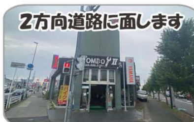
2方向道路に面します