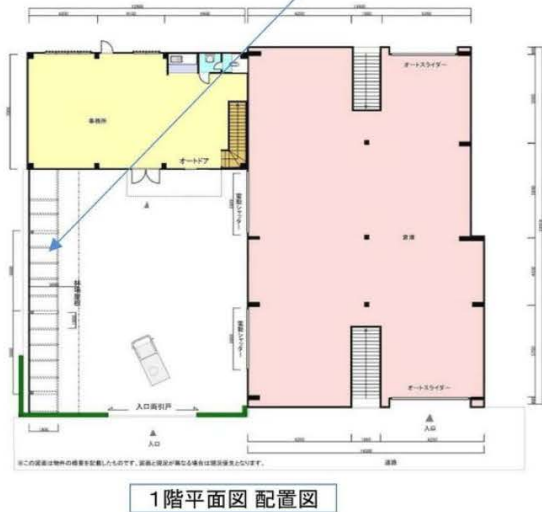
※この図面は物件の概要を記載したものです。