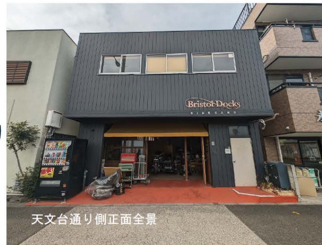
天文台通り側正面全景