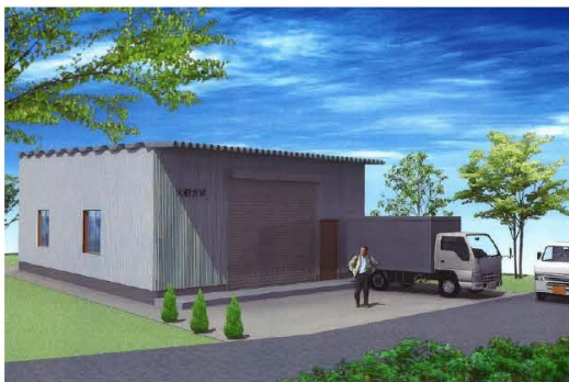
※こちらはイメージ図です。