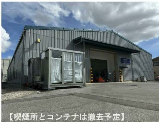
【喫煙所とコンテナは撤去予定】

電気・シャッター・駐車場・自転車置場 事務所は7°011°ソガ入・井戸水・本下水 ※キュービクルは残置物の為設備保証なし