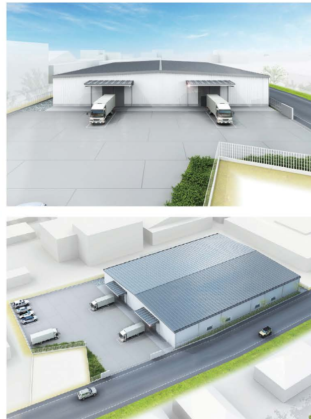
※2024年6月時点 完成イメージ