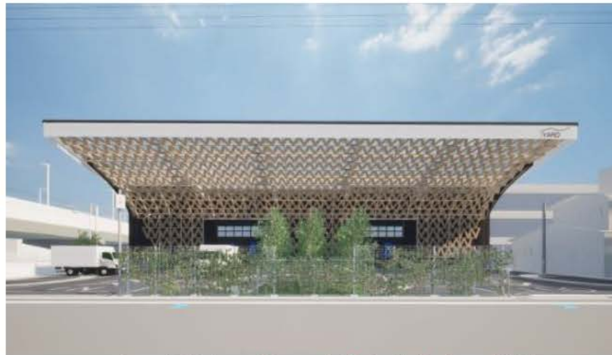
木の温もりで彩る、自然と共存する空間