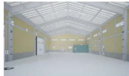
★天井高最大9.5m無柱空間