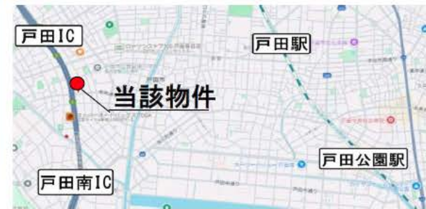
★準工業地域/近隣商業地域 アクセス良好