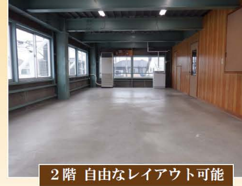
2階 自由なレイアウト可能