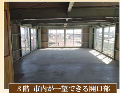
3階 市内が一望できる開口部