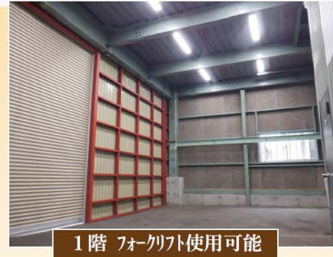
1階 フォークリフト使用可能

■神奈川県厚木市三田1-3-31 ■交通/小田急小田原線「本厚木」駅 バス14分「宿原入口」駅徒歩8分 ■築年月/平成3年11月築 ■構造/鉄骨造亜鉛メッキ鋼板ぶき3階建 ■土地面積/104.00㎡ ■建物面積/183.55㎡ ■土地権利/所有権 ■都市計画/市街化区域 ■地目/宅地 ■現況/空 ■引渡日/相談 ■用途地域/準工業地域 ■建蔽率/60% ■容積率/200% ■防火指定/22条区域 ■高度地区/なし ■地区計画/なし ■設備/東京電力・公営水道・公共下水 ■幅員/西側約6.0m公道・南側約4.7m私道 ■接面/西側約9.50m・南側約7.04m ■その他の法令上の制限/厚木市景観条例・厚木市すみよいまちづくり条例・神奈川県自然環境保全条例・土地再生特別措置法・日影規制 ■駐車場/有