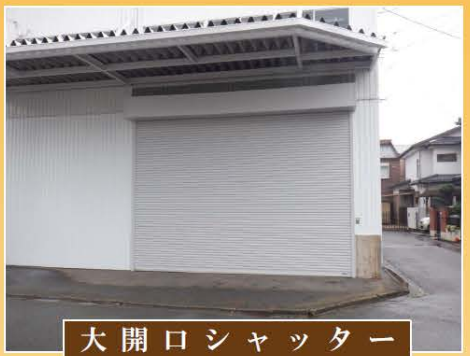
大開口シャッター 大きな張り出し庇

土地 104.00m 2 1階 60.43m 2 2階 61.56m 2 3階 61.56m 2