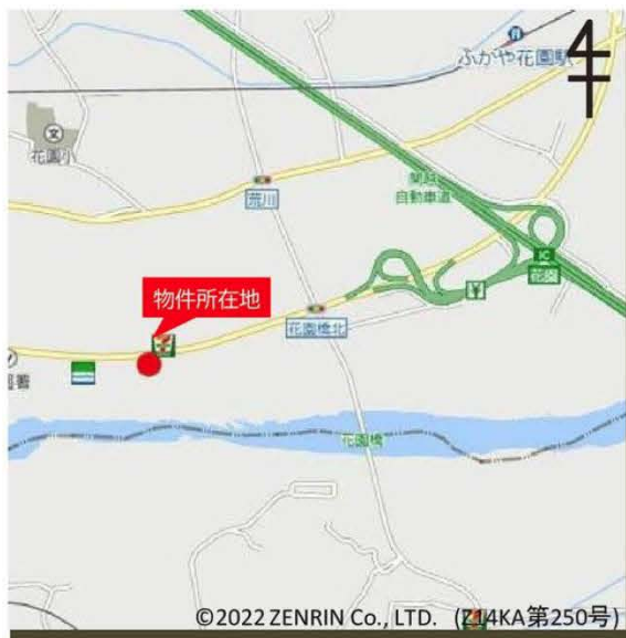
© 2022 ZENRIN Co., LTD. (Z14KA第250号)