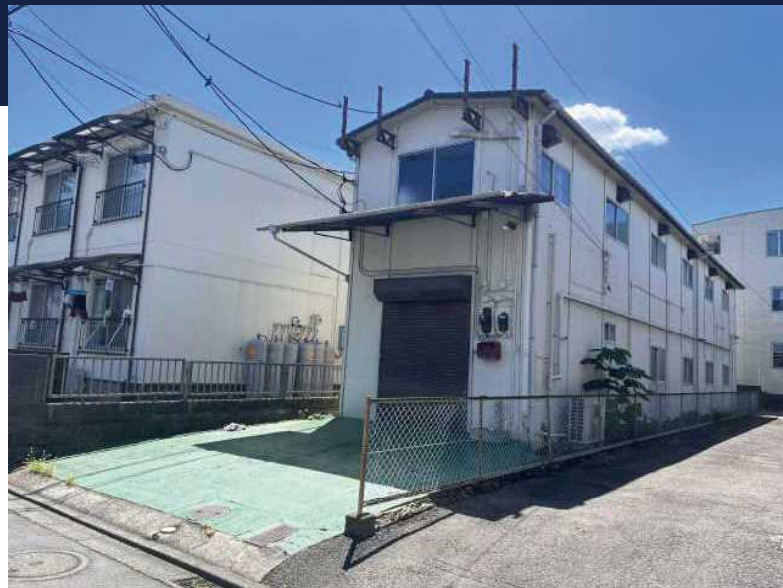
多摩エリア希少倉庫物件！ 240kgリフト 事務所利用可 駐車2台スペース付

物件番号：1301501 (前テナント：電気コイル製造、PCメンテナンス作業所)