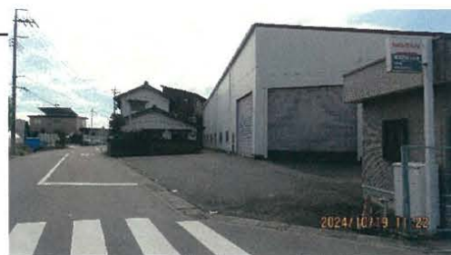
上記図面は概略図です。現況優先とします。