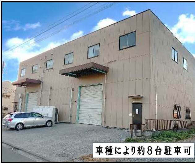
車種により約8台駐車可