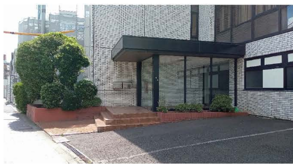
▲建物正面・エントランス