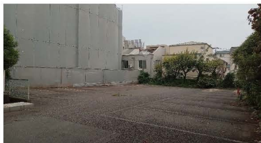
▲敷地裏駐車スペース