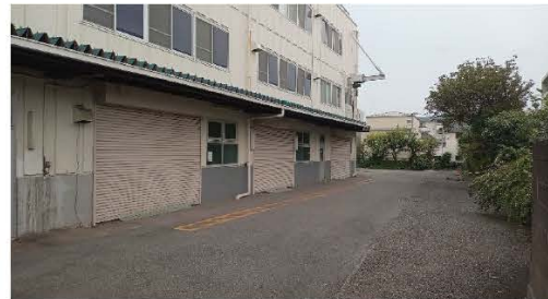
▲敷地裏倉庫搬入口、車寄せ