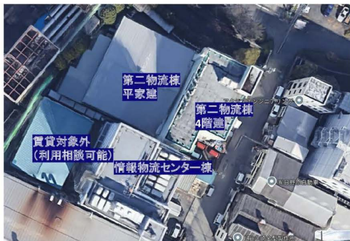
情報物流センター 1階