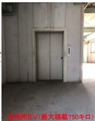
貨物用EV(最大積載750キロ)