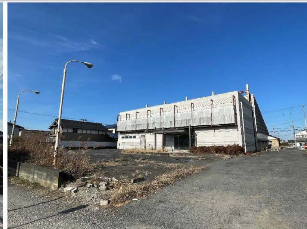
対象物件:南東側より撮影 (2024年1月撮影)