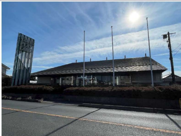
対象物件:北側より撮影