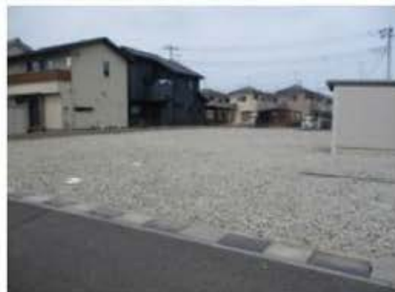
【南西側道路から撮影】