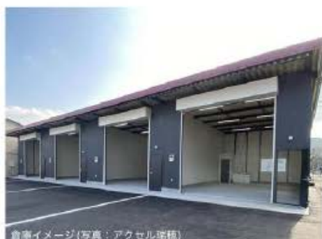
倉庫イメージ