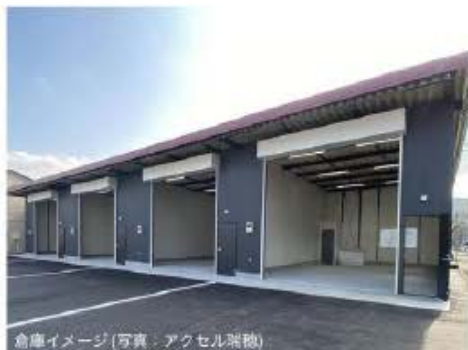
倉庫イメージ

24時間利用可,土日・祝日利用可,天井高2.5m以上,トイレ,電動シャッター,車寄せスペース,荷積みスペース,駐車場3台分以上