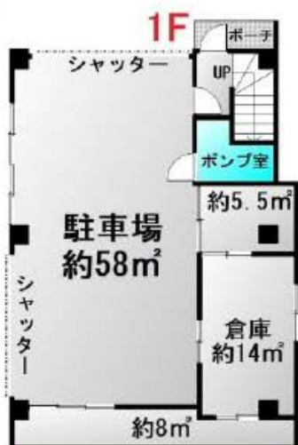
1Fのシャッターは残置物