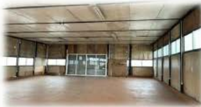
羽生市倉庫 間取り図