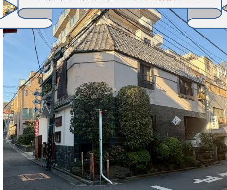
※現況と異なる場合は現況を優先します