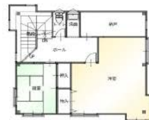
3階 平面図 S: 1/100