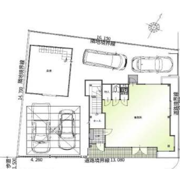
1階 平面図 S: 1/100