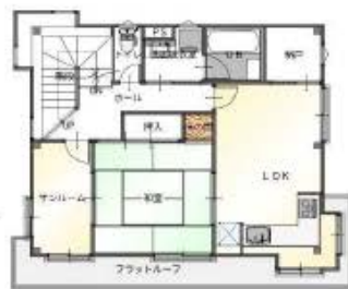
2階 平面図 S: 1/100