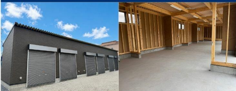
※掲載写真は同仕様建物のイメージです。実際の募集物件とは形状・外観・配置が異なります。