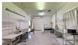
3階事務所スペース