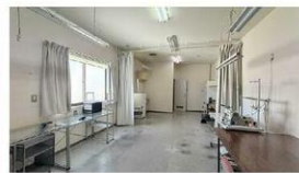
3階事務所スペース