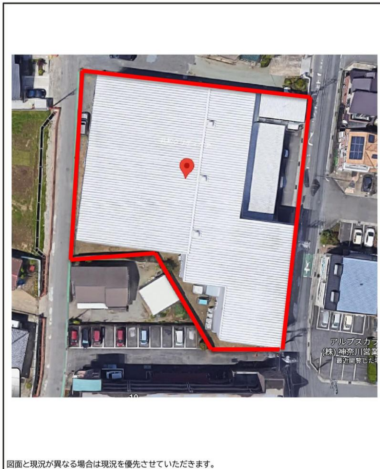
図面と現況が異なる場合は現況を優先させていただきます。