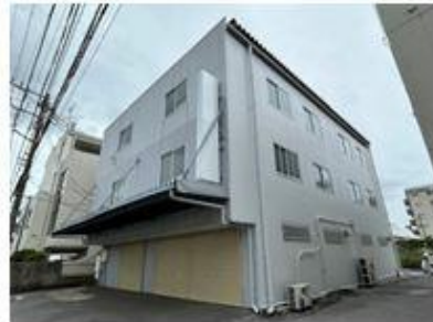
倉庫裏手シャッター及び看板