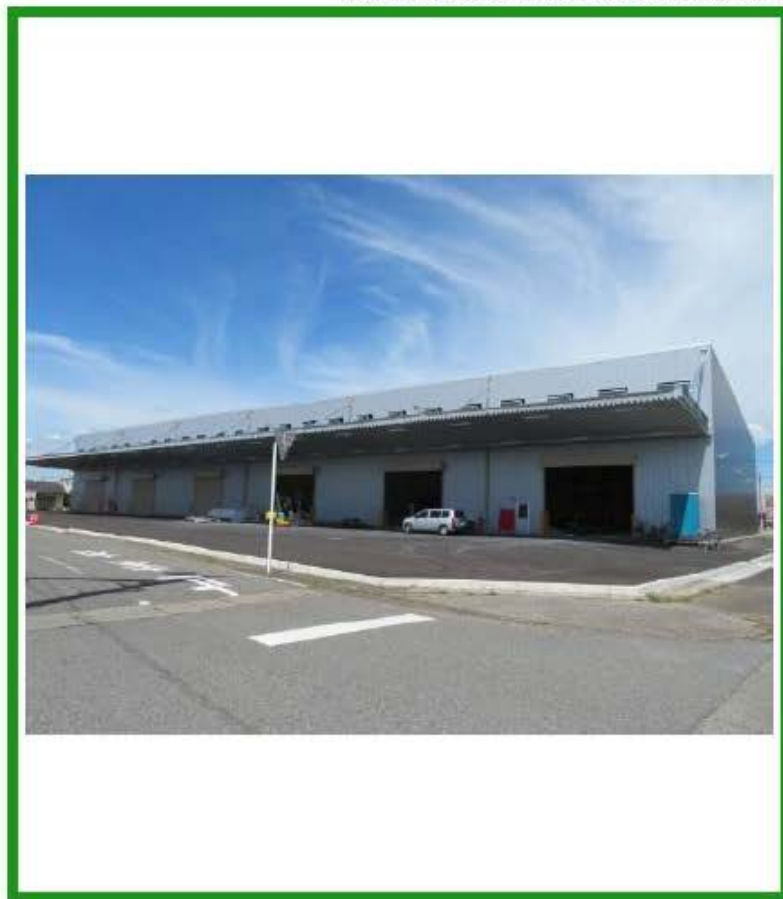
※写真の状況は、詳細は担当営業までお問い合わせください。