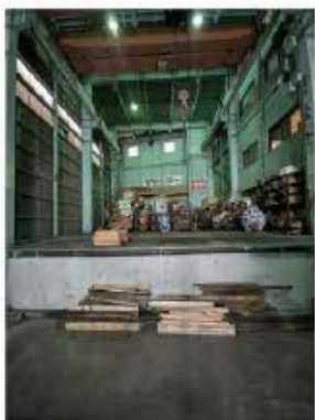
コンテナ車の荷台と同じ高さで床上げています。