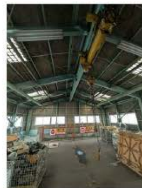
5階に開口有、1階から荷物を釣り上げて格納します。クレーン2台

※この図面はATBBの物件情報の一部を抜粋して掲載しております。(現況優先) ※入居日・引渡日変更や付帯条件、別途料金が発生する場合がありますのでご確認ください。