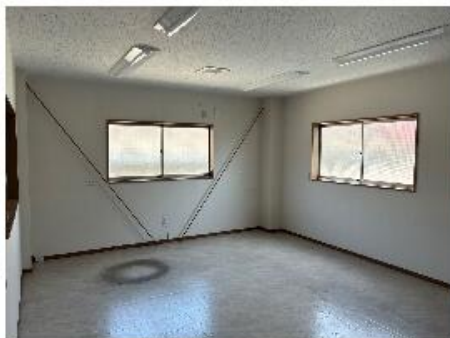
2階事務所スペース有