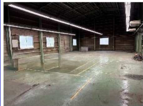
シャッター2カ所有