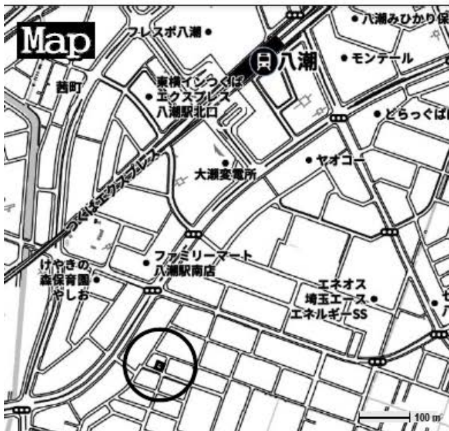
※ナビ入力「八潮市大字坊113の北側」