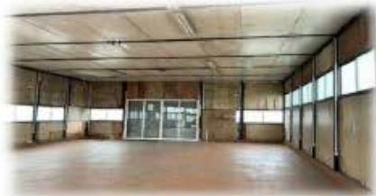
羽生市倉庫 間取り図