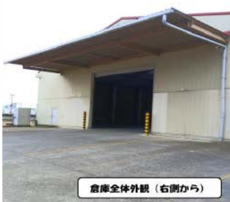
倉庫全体外観（右側から）