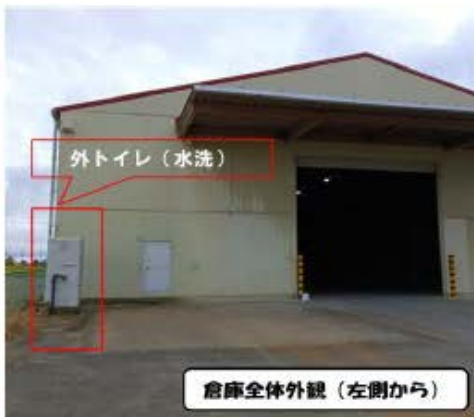
倉庫全体外観（左側から）