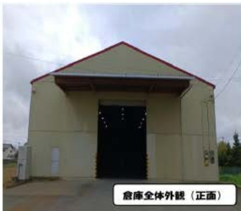
倉庫全体外観（正面）