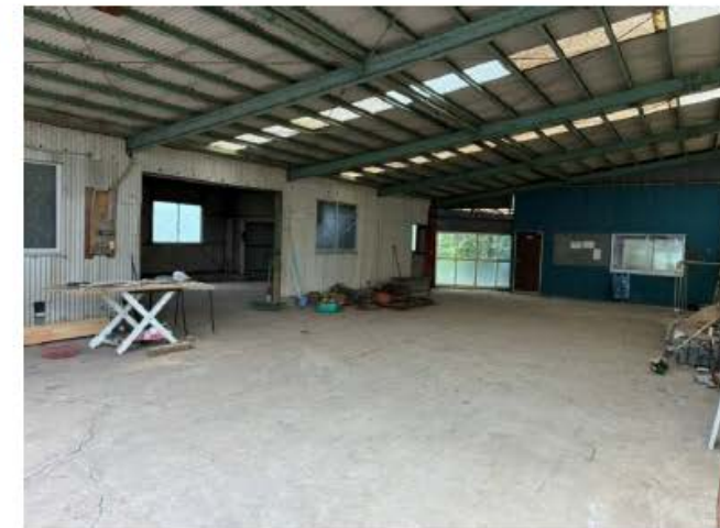
※図面と現況が異なる場合は現況を優先いたします